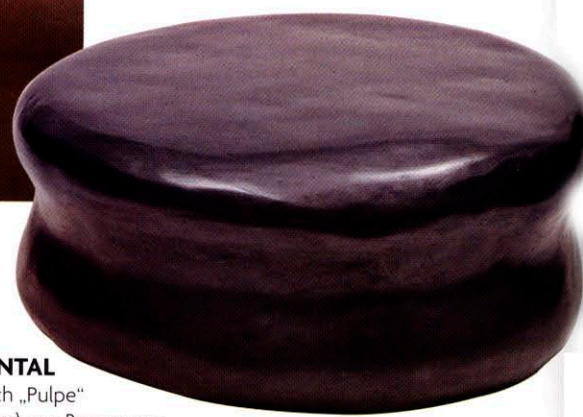
MONUMENTAL Beistelltisch „Pulpe“ (Ø 80 x H 31 cm), aus Bronze gegossen und patiniert. Von Christian Liaigre, 4100 €.