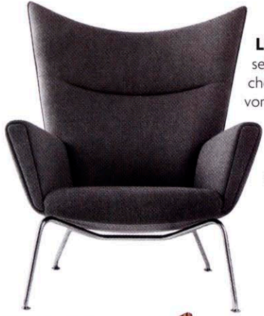
LESEPLATZ Ohrensessel „CH 445“ auf zierlichem Metallgestell, 1960 von Hans J. Wegner neu interpretiert. Mit Stoff oder Leder bezogen. Carl Hansen & Son, 3218 bis 4318 €.

KLARE FORMEN: EIN THEMA, VIELE SPIELARTEN VON CLEAN BIS COSY