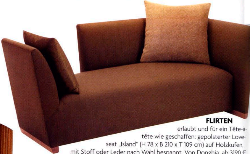
FLIRTEN erlaubt und für ein Tête-à-tête wie geschaffen: gepolsterter Loveseat „Island“ (H 78 x B 210 x T 109 cm) auf Holzkufen, mit Stoff oder Leder nach Wahl bespannt. Von Donghia, ab 3190 €.