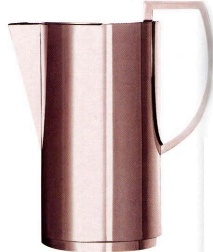
BRILLANT Kanne (H 22 cm) aus Sterlingsilber. Dieter Sieger Masterpieces by Robbe & Berking, 4500 €.